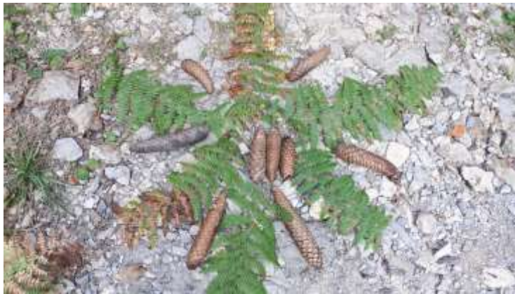
Pravljica je večernica, zato ker je za zvečer. (petletnik)